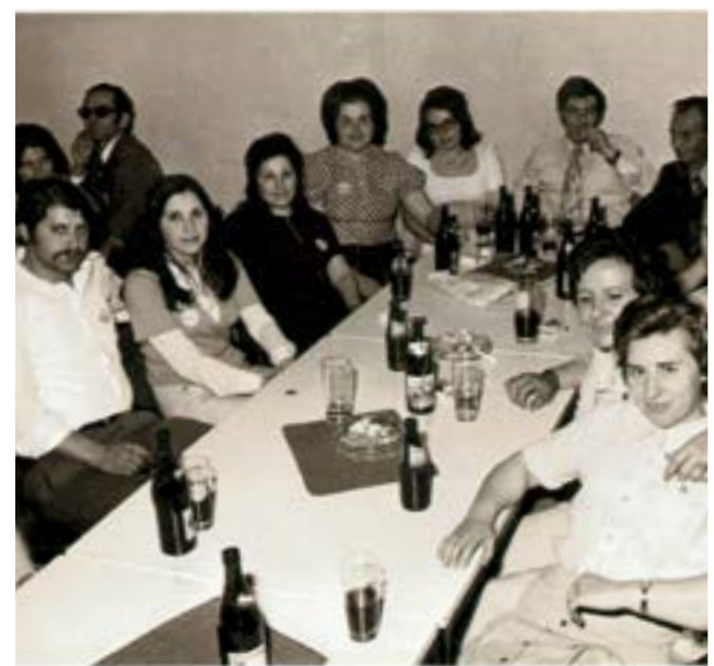
Firmenfeier Foto Athena Chrimpaki