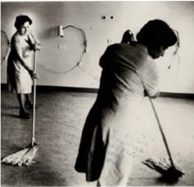
Griechinnen bei der Arbeit