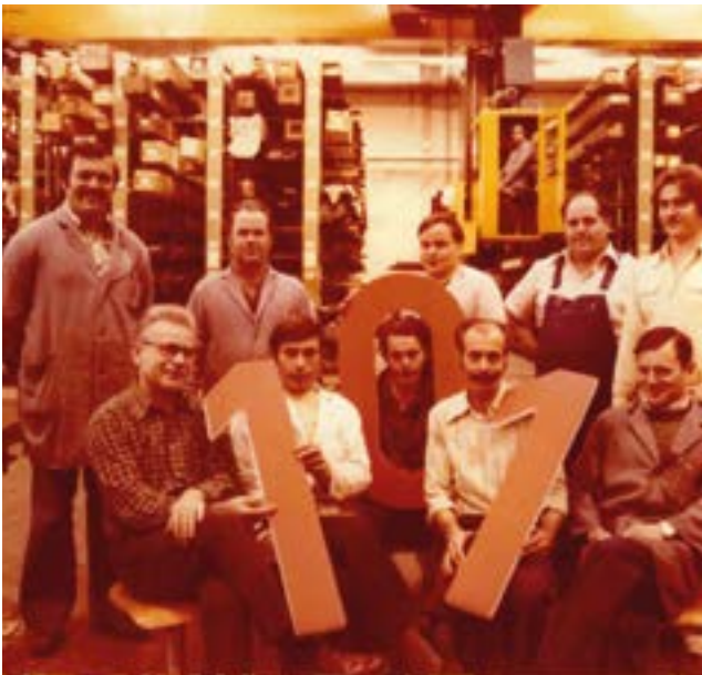
Siemens Abt. 101, Firmenfeier