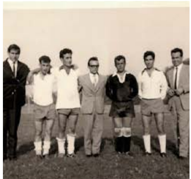
Fußballmannschaft Mühlacker