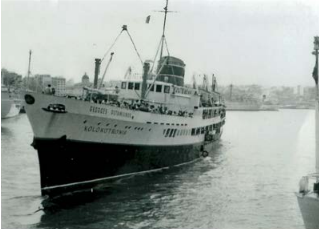
Fähre „ Kolokotronis“