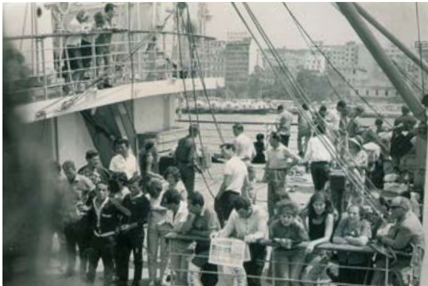
Hafen von Piräus

Unzählig sind die Abenteuer der Migranten, unzählig ihre Probleme in der Fremde, unzählig ihre Reisen, um auch nur für kurze Zeit bei ihren Familien zu sein.